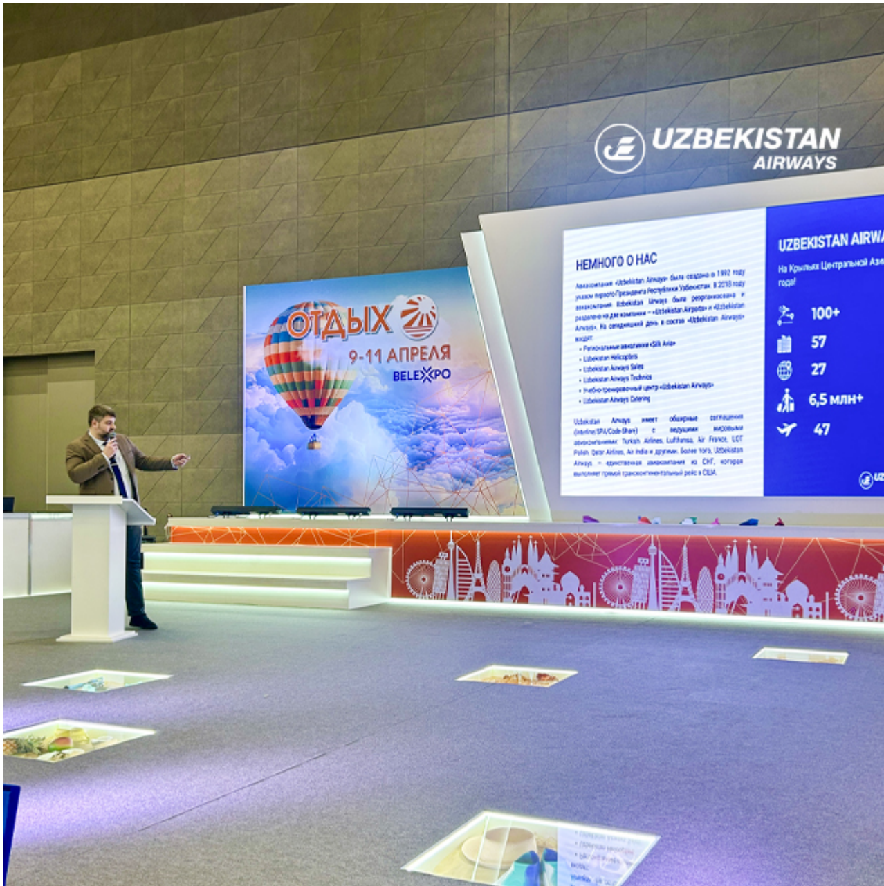
Рейсы по маршруту Ташкент – Минск – Ташкент выполняются трижды в неделю: по понедельникам, четвергам и субботам.